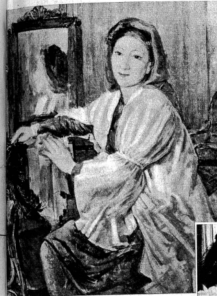
Portrait von Frau F.