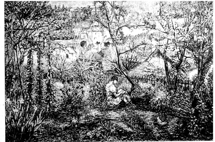
Landschaft im Altenberg