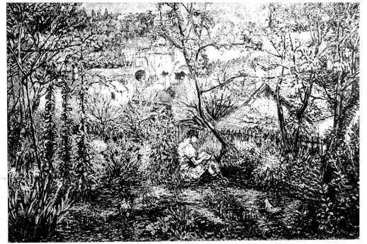
Landschaft im Altenberg

Unten: Das Männliche und Weibliche in der Natur