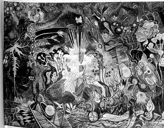
Unten: Das Männliche und Weibliche in der Natur

gerne dem Porträt, doch verraten auch ihre Landschaften ihr ausgesprochenes Können. In Vielem folgt sie den Ideen ihres Lebenspartners, doch bleibt sie immer einfacher und leichter verständlich.