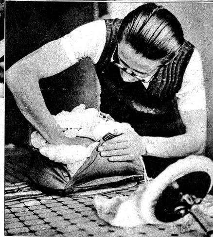
Rechts: Das Verpacken des Fallschirmes