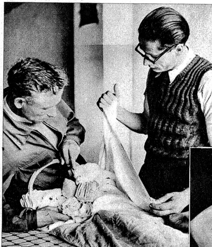
Oben: Das Bündeln der Schirmbahnen

Durch unsere Bildreportage werfen wir einen Blick in den ersten Kurs des eidg. Luftamtes für Fallschirmwarte. Wir sehen die angehenden Fallschirmwarte und ihre Instruktoren bei der Arbeit. Sie wissen, welch grosses Vertrauen ihnen die Luftfahrer entgegenbringen. Und sie wissen auch, dass hier, wie auf allen Gebieten der Luftfahrt, peinliche Genauigkeit, ernste und strenge Pflichterfüllung Ehrensache ist. Ti.