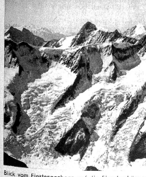
Blick vom Finsteraarhorn auf die Fischerhörner, Aletschhorn und Gross-Grünhorn