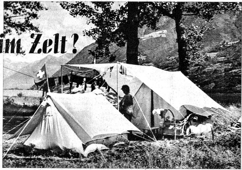
Die Zeltstadt an einem romantisch gelegenen Flecken Erde, an einem See Links: Neben den Vergnügungen und freien Stunden gibt es für die Mutter auch Verpflichtungen, und sie putzt mit dem feinen Sand am Strande die Kochkessel, bis sie glänzen