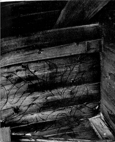
Detailausschnitt aus der Arbeit. Die kaum sichtbaren Motive werden sorgfältig mit Kohle in ihren Konturen sichtbar gemacht