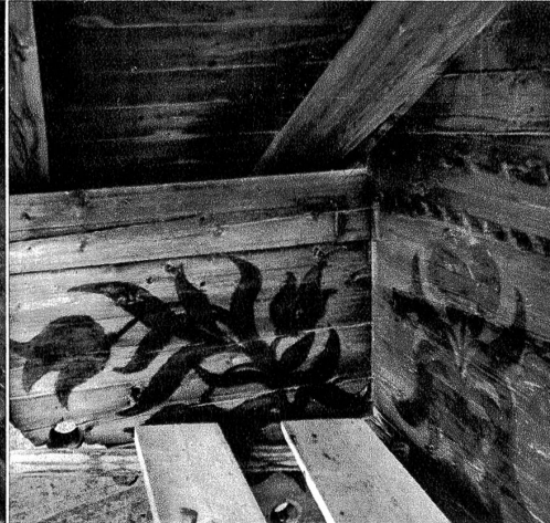
Nach dem Einölen wird das betreffende Motiv im Grundriss deutlich sichtbar