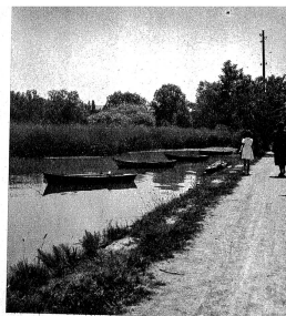
Schöne Spazierwege führen überall am Ufer entlang

Bergtour, die sich müheles in ein Tagesprogramm einfügt, so steigen wir auf den Chasseral (1800 m), dessen unvergleichliche Aussicht weit ins liebe Schweizerland hinein und sogar noch über seine Grenzen hinaus ins unglückliche Frankreich bekannt ist.