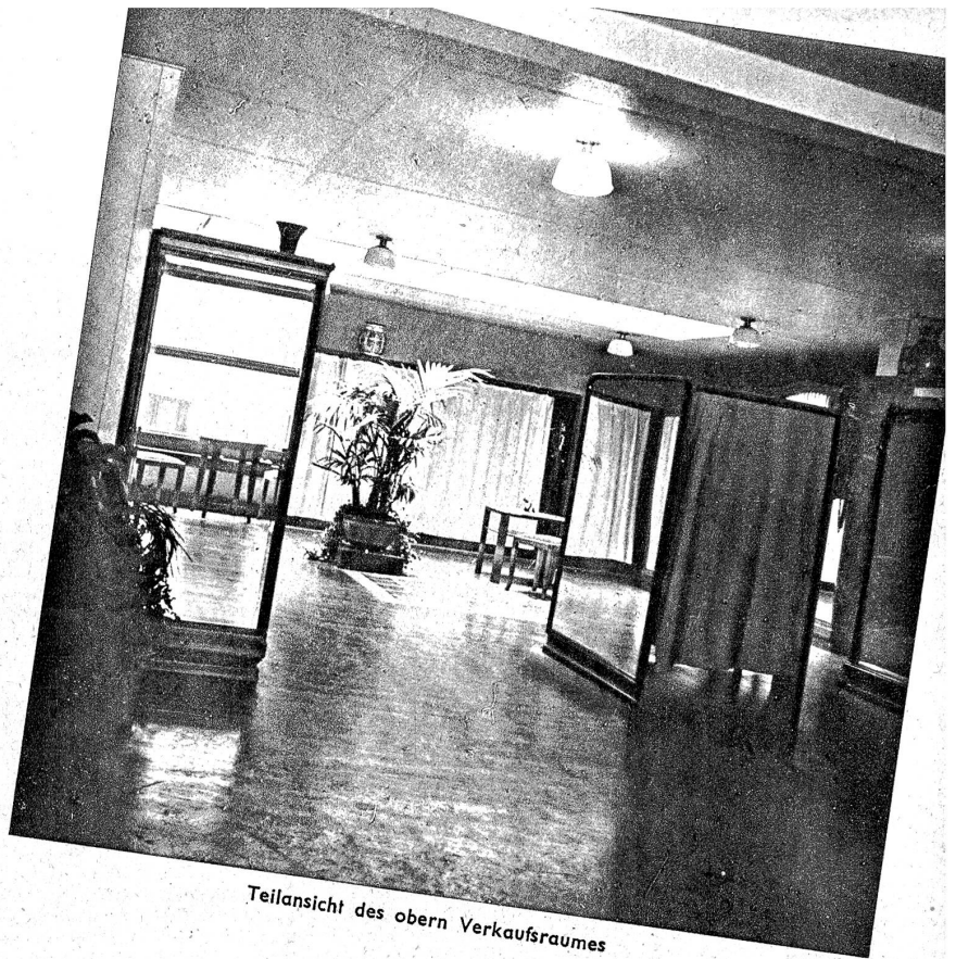
Teilansicht des obern Verkaufsraumes

ist eine seltene Gabe, ist er aber gegeben, so wird er auch zum Schöpfer des Schönen und Nützlichen.