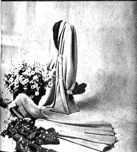
Praktische und schöne Mäntel...

Unten: Farbenfrohe Kleidchen für den Sommer geben den Schaufenstern der Firma ein ganz besonderes Gepräge