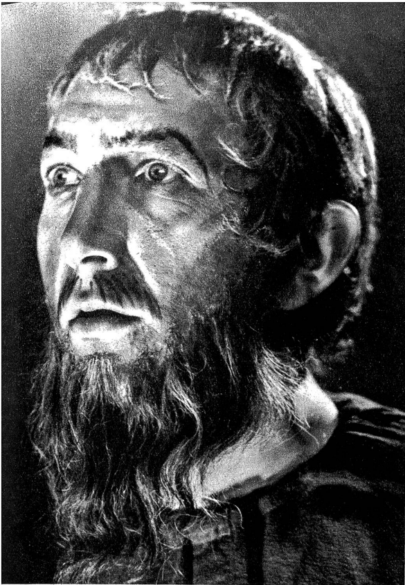
Chlaus vo Flüe

Goethes «Faust» auf dem Weinmarkt. Er ist der Vers aller Luzerner Spiele des 15. bis 17. Jahrhunderts — kurz, er ist der Vers unseres Volkstheaters in einer Zeit, da man noch «Stiltheater» spielte und noch nichts wissen wollte vom Naturalismus alltäglicher Prosa. — Die Zahl der sprechenden Rollen musste vermindert, alle Hauptspieler sollten zueinander in schicksalhafte Beziehung gebracht werden. So ergab sich als Kern der Handlung der Kampf um Bruder Klausens um seine Sendung, seine Loslösung von den Aemtern, der Familie, sein Hineinwachsen in seinen hohen Beruf — und als Gegenspieler meldeten sich die Politiker: der schwankende Landammann Eiwy, der Kriegshetzer Heinzli, der grossmachtsüchtige Waldmann, dann die Familienmitglieder Frau Dorotee und Sohn Hans. Als Mittler zwischen den zwei Polen — als Mittler im Familienkonflikt und im Streit der politischen Parteien — tritt ein Helfer dazwischen, der Stanser Pfarrer Heimo Amgrund. Der eigentliche Träger der Handlung ist trotzdem, vor allem im ersten und letzten Akt das Volk. Die paar Einzelfiguren treten aus seiner Mitte wie Chorführer heraus.