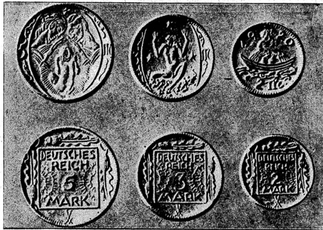
Deutsches Porzellanget, wie es an Stelle von Silbermünzen im Jahre 1920 hergestellt wurde

1. Römischer Goldbarren mit der Aufschrift: „Proculus hat dieses Geld geschmolzen und haftet daher für seine vorschriftsgemässe Reinheit.“ 2. Löwenförmiges Geldgewicht aus Abydos mit Inschrift: „Genau befunden von den Hütern des Geldes.“ 3. Ein ägyptisches Goldtalente, die zu einer Art Waage verbunden sind