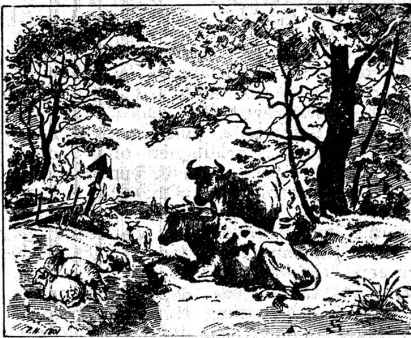
«Wo ist der Junge, der die Kühe und Schafe beaufsichtigt?»

Gewissermassen als scherzhafte Einzelfrage traf man ebensooft wie das Bilderrätsel — den sogenannten Rebus — auch das Vexierbild .