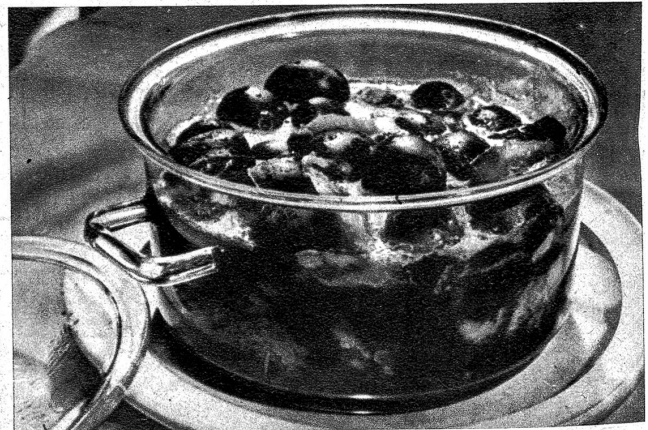
Pflaumen mit Speck

In eine gebutterte und mit Paniermehl ausgestreute Form gibt man lagenweise Äpfel und Rosinen oder anderes Obst, Zucker und Paniermehl. Ueber das Ganze giesst man \frac{1}{4} l Milch, in der man 1 bis 2 Eier verrührt hat sowie etwas Most, streut, wenn möglich, kleine Butterflöcklein auf die oberste Paniermehlschicht und bäckt zirka 45 Minuten. Dieser Auflauf kann auch mit Zwieback oder Weizenflocken gemacht werden.