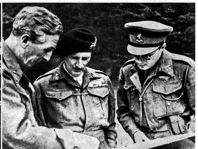
Prinz Bernhard der Niederlande, der Kommandant der niederländischen innern Streitkräfte, ist an der Grenze seines Landes im englischen Hauptquartier eingetroffen