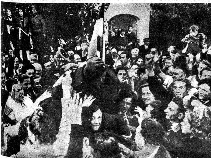
Jubel in Luxemburg: Prinz Felix von Bourbon-Parma, der Gemahl der überaus beliebten Grossherzogin Charlotte ist in seiner Hauptstadt eingetroffen

Es kam alsdann, nach den siegreichen Durchbrüchen nördlich der Seine und in Südfrankreich, zu völlig umgekehrten Vorstellungen: Der Marsch nach Berlin schien manchen Leuten nur noch eine Frage von Wochen. Der deutsche Zusammenbruch sollte sozusagen vor der Tür stehen. Aehnliche Perspektiven schienen sich einen Monat früher auch im Osten, dicht vor Warschau und der ostpreussischen Grenze, abzuzeichnen, ohne dass die Optimisten Recht erhielten. An beiden Fronten erwies es sich, dass die grossen Sturmzüge der Verbündeten nicht weiter als ihr Atem reichen konnte. Die Russen mussten stehen bleiben und umorganisieren. Mehr als 900 km Vormarsch erzwangen die Regelung neuer Nachschublinien. Im ganz gleichen Falle standen die alliierten Armeen nach den gewaltigen Panzerdurchbrüchen und nach dem Marsch