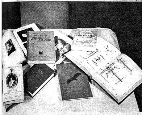
Nicht unbrauchbare Makulatur geht in die Lager, weil es sich ja „nur um Gefangene“ handelt. Treffliche, moderne Werke werden geschenkt und von den Buchdruckereien zur Verfügung gestellt: Es geht darum, den Geist der Gefangenen und Internierten beweglich und gesund zu erhalten