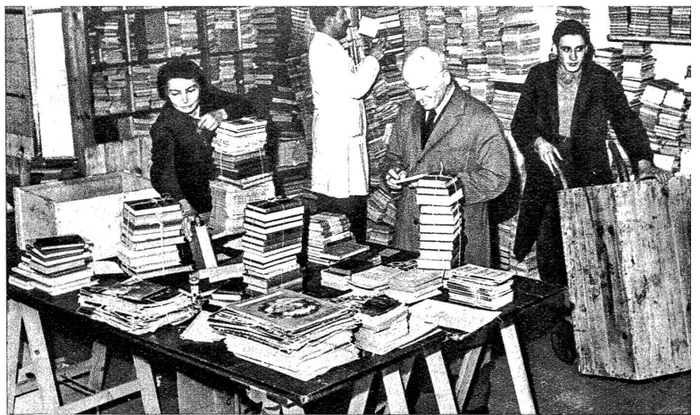
Oben: Aus den Heimatländern der Gefangenen treffen in Genf Pakete mit wertvollen Bänden ein, bestimmt zur Verteilung an die Gefangenen in den Lagern. Die Helfer im zentralen Bücherlager müssen nicht nur sprachenkündig, sondern auch gut belesen sein, um alle Wünsche der Gefangenen so gut wie möglich berücksichtigen zu können