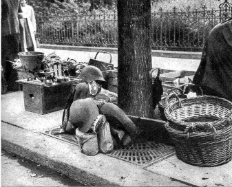
Dr Vater u der Sunn hei müesse yrücke, si hei der Turnlster bim Mueti schnäll zueche gäh, um no eis ga z'zieh