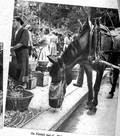
Ds Föchsli het si „Haber“ ou verdienet

Letscht Wuche bin i einisch dr Märth vo hinde ga mache, zwar han i statt es Märthhörblider Fotiapparat bi mer gha. Da gseht me allerhand lustigi und glungnigi Sache. I bi ersch vo de nöne a gange, aber i der churze Zyt han i scho gnue gseh. Ds Ganze chunt mer vor wie ds Läbe uf em ne Ameischufe