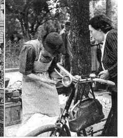
Will die Dame ds Velo het, wird si halt o vo der hindere Syte bedient