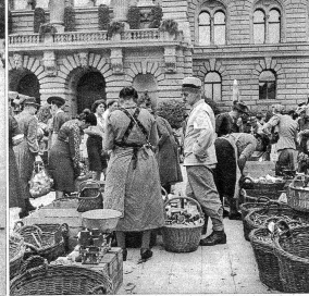
E gärn gsehne Ma, dá Gremsschnittfabrikant, er tuet dene Burefroue ds Läbe versüesse