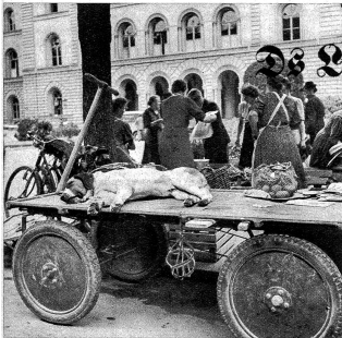
Dr Seppu het scho fröh uf mouesse, drum nimmt är gärn grad es Nückli uf sim guet abafäderete Gilger