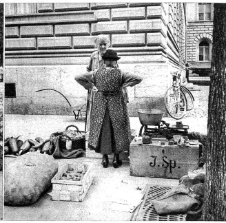
Grad wie der Napoleon uf em Schiachthugel stelt das Froueli da, um siner „Chunde“ z'empflih