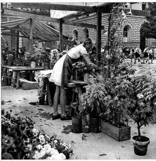
Ds Marfeli het grad kei Chundschaft, es tuet wieder chli Ornig moche uf sim Ladelsch