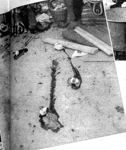
Der Hunger plöget's schulztech

Links: Schad für da Eierfätsch am Bode. Die Eier het zwar nid es Suppehuhn la gheite, aber es anders