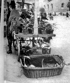
Dr Bäru isch froh, wenn albe sofort e Chorß lär wird, er pfuset nämlech nid gärn uf em blosser Bode