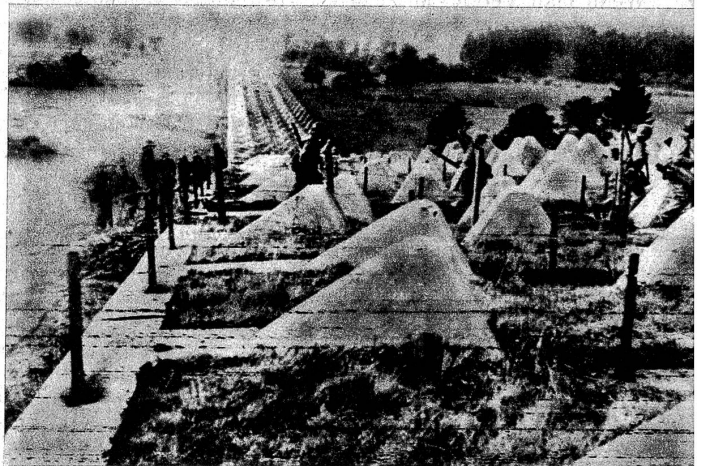
Funkbild von der Siegfriedlinie: Amerikanische Infanterie passiert die Tanksperren

Mit grosser Zuversicht wird in Berlin verkündet: «Deutschland ist wieder im Kommen!» Die Westfront hätte sich demnach gleich wie die Ostfront stabilisiert. Alle weiteren Angriffe der Alliierten würden ihnen nichts anderes als schwere Verluste einbringen. Die totale Mobilisierung würde ihre Früchte zeitigen, und wenn erst die V2 zum Einsatz gelange, müsse sich das Blatt wenden. Nach verschiedenen Gerüchten und Beschreibungen soll diese Raketenbombe furchtbare Wirkungen haben. Kilometerweit würde entweder durch eine unvorstellbare Lufterschütterung jedes lebende Wesen umgebracht, oder dieselben Effekte kämen infolge einer «Atomzertrümmerung» zustande. Man hat in England teils mit Achselzucken, teils mit aufmerksamen Ohren registriert, was die Gefangenen sagen. Sie sollen in der Tat unter der Suggestion stehen, dass es nur bis zum Einsatz dieser Ueberwaffe auszuhalten