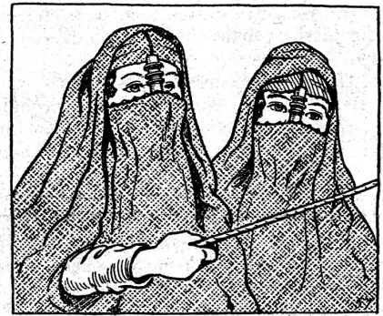
57. Hinten auf dem Wagen sassen zwei Weiber, deren Gesichter nach dem Brauch des Landes mit Schleiern bedeckt waren, welche nur die Augen und einen Teil der Stirne und die Backen frei liessen. Ein vergoldetes Holzröllchen, das ihnen auf der Nase hing, diente dazu, den Schleier etwas vom Munde abzuheben und das Atmen zu ermöglichen.