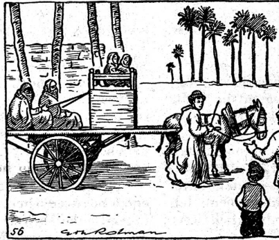
56. Gottlob, da kam knarrend und quiekend ein sonderbares Gefährt herbei, so wie sie die ägyptischen Bauern gebrauchen, wenn sie mit Frau und Kindern nach der Stadt fahren. «Holla, können wir mitfahren?» rief der Pilot in einem Sammelurium von Englisch und Arabisch. Der Wagen hielt und unsere Freunde traten näher.