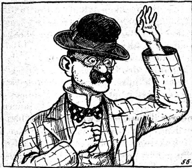
55. Sodann setzte er sich den Hut quer über den Kopf, steckte die Finger zwischen die Weste und rief aus: «Von dieser Stelle rief einst Napoleon seinen Soldaten zu: Zwanzig Jahrhunderte schauen auf euch hernieder!» Karlchen fand dies sehr schöne Worte, und der Vater, meinte er, gleiche dem grossen Napoleon bis aufs Haar.