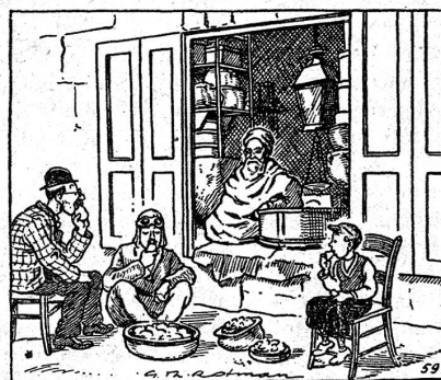
59. Weil sie einen Bärenhunger hatten, liessen sie sich vor einem «Restaurant» nieder, wo sie ziemlich billig allerhand Südfrüchte genossen. Es war ein inländisches Geschäft, das nur über zwei schwankende Stühle verfügte, so dass der Pilot sich mit einem Sitz auf dem harten Boden zufrieden geben musste.