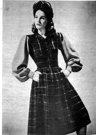
Warmes Kleid aus schwarz-weißem Wollstoff mit knallroten Ärmeln Links: Elegantes Nachmittagskleid für den Herbst und Winter aus schwarzem Wollstoff in Verarbeitung mit schwarzer Seide. Neuartig ist die schöne Applikationsborde am Rock