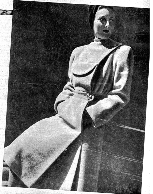
Bild rechts: Heller, warmer Wintermantel mit Seitentaschen und originellem Revers am Vorderteil

Fertigstellung: Der Riemen wird zusammengeknäht und in hellbeige mit festen M an das Vorder- und Rückenteil gehäkelt. Dabei nur halbes Glied fassen. Bevor die beiden Teile zusammengehäkelt werden, sollen sie feuchtgelegt werden. Das Futter 1 cm kleiner schneiden. Als Verschluss einen Reißverschluss einarbeiten. Aus einer Luftmaschenkette wird der entsprechende Name aufgenäht.