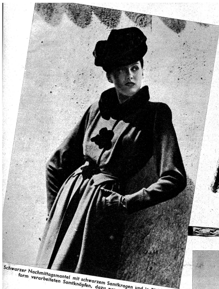
Schwarzer Nachmittagsmantel mit schwarzem Samtkragen und in Blütenform verarbeiteten Samtknöpfen, dazu passender Samthut