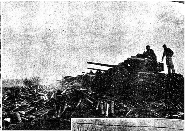
Oben: Funkbild aus dem Raume von Venlo. Mit welchem Einsatz an Material in dieser unheimlichen Abnützungsschlacht gekämpft wird, vermittelt dieses Funkbild. Tanks der britischen 2. Armee, sozusagen als Mauer nebeneinander aufgebaut, speien aus einem Wald von Feuerschlünden auf die deutschen Stellungen