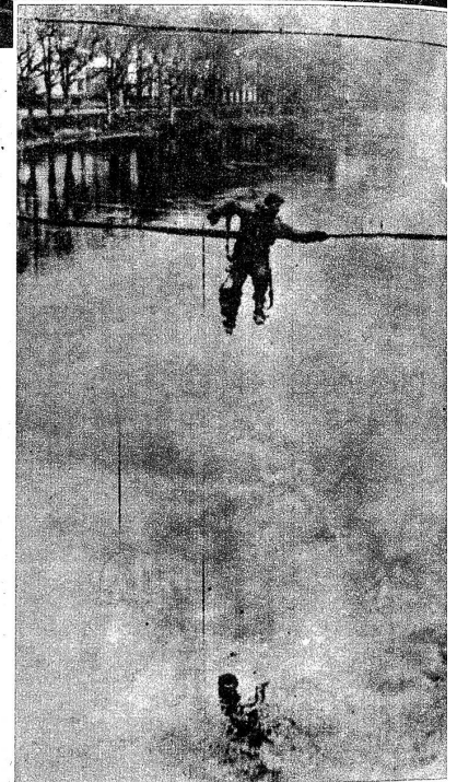
Rechts: Von den Vogesenkämpfen. Ungeheure Leistungen werden von den Soldaten heute in den schweren Kämpfen im Westen verlangt. Die amerikanische 7. Armee fand bei Epinal gesprengte Brücken vor. Die Vorausabteilungen mussten deshalb die Mosel an Drahtseilen überqueren

aus dem Lager der Alliierten — es sind nicht die «amtlichen» — wollten wissen, dass überhaupt keine verfügbaren Brücken mehr bestünden. Es erwies sich alsdann, dass die nach Kehl führenden Strassburger Uebergänge noch völlig in der Hand der Deutschen waren. Von hier aus bis weit nach Süden beherrschten sie beide Stromufer.