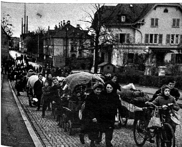
Tagen der Schlacht bei Basel, welchen die französische Erste Armee den überraschenden Einbruch ins Elsass den Deutschen lieferten, bildete für Tausende von Flüchtlingen aus dem Elsass die einzige Rettung vor dem fast sicheren Untergang

Das Bild, welches der deutschen Oeffentlichkeit geboten wird, ist etwa folgendes: Sowohl im Sundgau als weiter nördlich, in der Senke von Zabern, sind französische und amerikanische Panzerverbände durchgebrochen. In den Vorstädten von Mülhausen und Strassburg finden Kämpfe statt. Massnahmen zur Abschneidung dieser durchgebrochenen Stosskolonnen waren am 24. November im Anlaufen. Sowohl am Rhone-Rheinkanal wie droben im Lothringischen bereitet sich die Abschneidung vor. Südlich von Altkirch nähern sich die deutschen Gegenangriffe der Schweizergrenze bei Delle. In Metz und Strassburg, auf den Vogesenpässen und noch westlich davon wird weiter Widerstand geleistet. Zur Hauptsache sind hier alle feindlichen Angriffe abgeschlagen worden. Ungefähr so sieht das Bild aus, das der aufhorchenden deutschen Masse gemalt werden muss. Im übrigen wird das Schwergewicht der Berichterstattung gar nicht aufs Elsass, sondern auf den Aacheneraum gelegt, wo die Schlacht unverändert um die Ruinen von Geilenkirchen , Eschweiler , Weisweiler , Jülich und andere noch westlich der Rœr liegende Orte tobt, wo sich amerikanische und deutsche Gegenangriffe ablösen