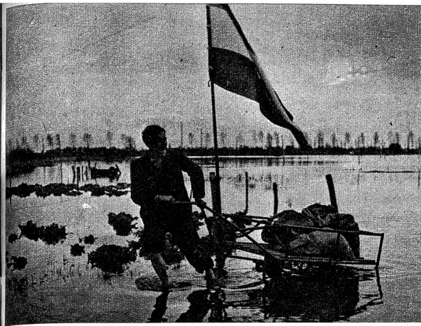
So lebt Holland — heute. Weite Strecken Hollands sind heute frei, wie die Fahne anzeigt, aber leider auf Jahrzehnte hinaus verwüstet

die Desorganisierung des Nachschubes durch die amerikanische Luftwaffe weithin wirksam gewesen.