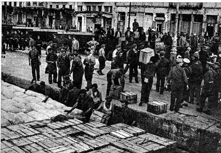
Im Piräus, in Griechenland trafen die ersten spürbaren Lebensmitteltransporte der Alliierten ein, welche dem so lange Zeit darbdenden Volke Griechenlands zur Freiheit nun auch noch Brot — und was dazu gehört — brachten

noch gelinge. Nördlich Colman wurden um den 27. November deutsche Abteilungen von unbekannter Stärke ans Ostufer des Stromes übersetzt. Die verfrühten Nachrichten