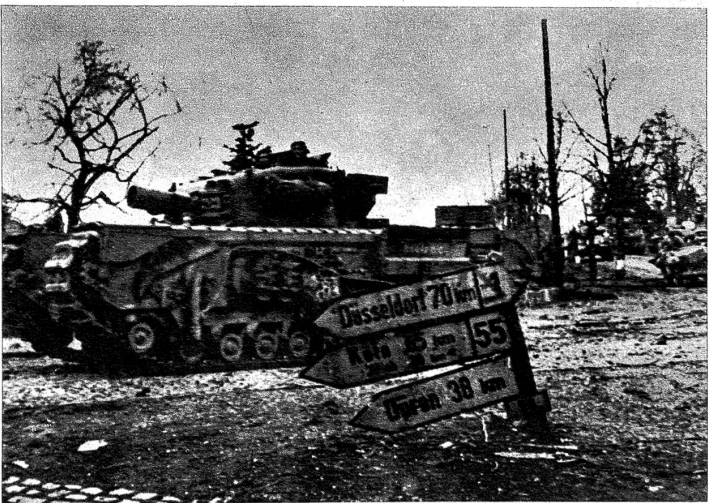
Die Schlachten um Geilenkirchen. Mit zäher Energie verteidigten die Deutschen dieses kleine Städtchen bei Aachen. Unser Funkbild zeigt einen britischen flammenwerfenden Tank, der nach Geilenkirchen beordert ist, um Widerstandsnester auszuräuchern