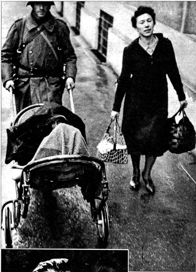
Links: Flucht in die Schweiz. Tausende von elsässischen Flüchtlingen suchten in Basel Zuflucht, als auch das Oberelsass zum Kriegsschauplatz wurde. U. B. zeigt einen unserer Soldaten, wie er ein 88jähriges Mütterchen, das nicht mehr gehen konnte, auf einem Sanitätswagen in Sicherheit bringt (VI Bu 16822)