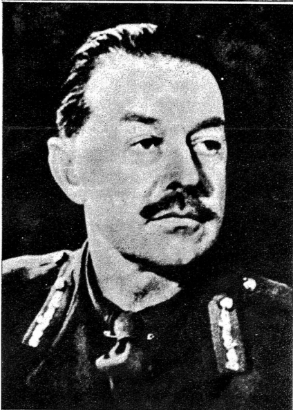
Links: General Sir Harold Alexander , bisher Kommandant der alliierten Truppen in Italien, wurde unter gleichzeitiger Beförderung zum Feldmarschall zum Oberkommandierenden der alliierten Streitkräfte im Mittelmeergebiet ernannt