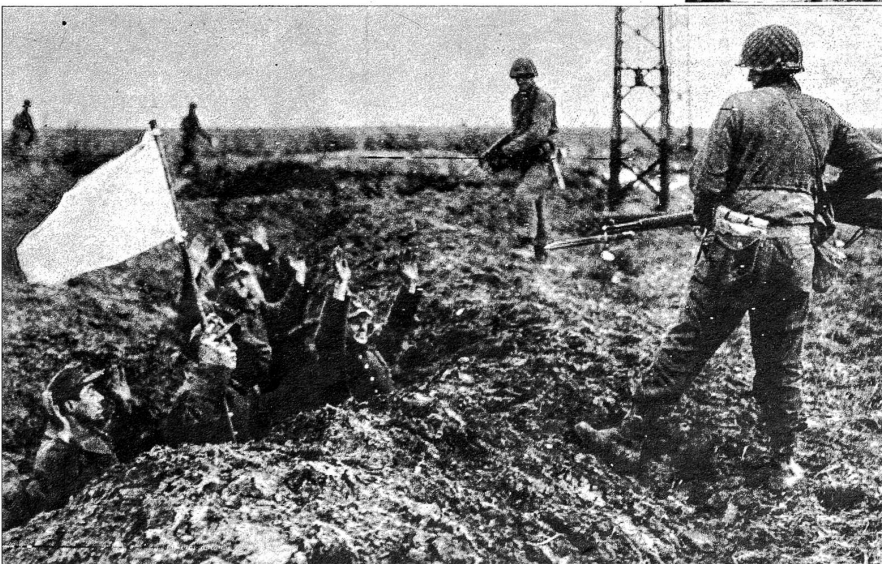
Links: Die weiße Fahne. Eine deutsche Grabenbesatzung hat sie in der Gegend von Geilenkirchen gehisst zum Zeichen ihrer Übergabebereitschaft. Mit erhobenen Händen lässt sie sich von den Amerikanern gefangen nehmen (Funkbild)