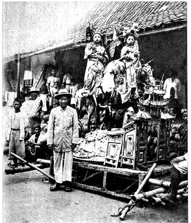
Djenggehgruppe, zu Pferde, hinter einem Tempel reitend, auf starkem Traggestell. Die Kostüme sind oft von grosser Kostbarkeit und begehrte, aber nur selten erworbene Sammelobjekte. Ein alter Chinese überwacht die traditionsgetreue Aufmachung