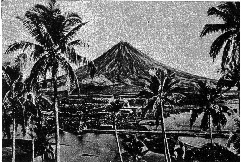
Zu der von Tokio gemeldeten Landung der Amerikaner auf der Philippinen-Insel Luzon. Unser Bild zeigt den Mount Mayon auf der Insel Luzon, der mit 2417 m die höchste Erhebung auf der Philippinen-Gruppe ist

westlich von Budapest stehen die Dinge ähnlich auf des Messers Schneide, wie im belgischen Keil. Die Nachricht, dass von Komorn her eine Entsatzarmee angreife, steigerte in Buda und Pest den Fanatismus der Verteidigung aufs höchste. Buda war schon am 6. Januar zu drei Vierteln in russischer Hand. In Pest hatten sie sich bis ins Zentrum hineingearbeitet und an einer Stelle den Durchbruch an die Donau erzwungen. Das bedeutete praktisch die Aufspaltung der Deutschen in drei Gruppen. Aber jede Gruppe vermochte sich zu halten, und den angreifenden Stosstrupps blieb meist nichts übrig, als Häuserblock um Block zu sprengen. «Wie in Stalingrad » geht das Ringen um das Hippodrom und die Untergrundbahn , um die Mes-