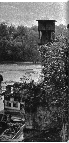
Blick von der Plattform gegen das Aarebecken. Hier an der Wand reifen im Herbst 1944 eine Anzahl Äpfel. Der Luft ist nicht gerade eine Zierde, doch für die Bewohner der Matte eine Erfreicherung

die Ecke und die Kapelle musste abge- tragen und ein weniger gefährdetes Stand- ort neu aufgebaut werden. Die schadhafte Ecke wurde dann von Grund auf neu ver- sichert, welche Arbeit acht Jahre dauerte. Am 24. März 1491 tritt in der Geschichte der Münsterterrasse insofern eine Wen- dung ein, als der Rat erliess, «dass der Kirchhof jetzt für hin frey seyn, und die Begräbnis beyne oberen Spital Barfässen und niederen Spital seyn söllend», so dass nach Ablauf einiger Jahrzehnte eine Promenade entstand. 1560 wurde dieser Ort jedenfalls schon als Turnplatz benutzt, so dass ein «Rath-Zettel» an- gebracht wurde, der den Knaben das «Klücken» verbot.