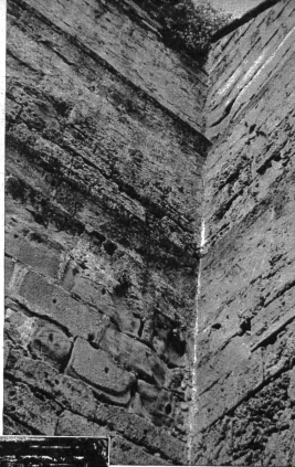
Die östliche Mauer beim nördlichsten Pfeiler. Die Spuren der Zeit haben sich tief in den Sandstein ein- gegraben, während der Tuffstein beständiger ist

Früher, als Bern noch in seine Mauern eingesenkt war, erlebte die Plattform grosse gesellschaftliche Veranstaltungen. Heute jedoch strebt sie wieder einer ruhi- gen, des nahen Münsters würdigen Epoche entgegen. Fern vom Weltgetriebe blickt man von ihr aus auf die rauschende Aare an der Schwelle unten und erkennt in diesen beiden den Willen und die Weite Alt-Berns. M. Feurich.