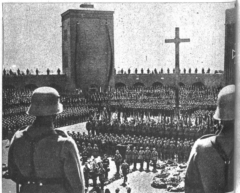
Der Einbruch der Armeegruppe Rokossowsky in preussisches Gebiet hat am letzten Tag zur Einnahme von Tannenberg, wo Generalfeldmarschall von Hindenburg ruht, geführt. Wir zeigen eine Gesamtübersicht des Ehrenmals anlässlich der Bestattung Hindenburgs