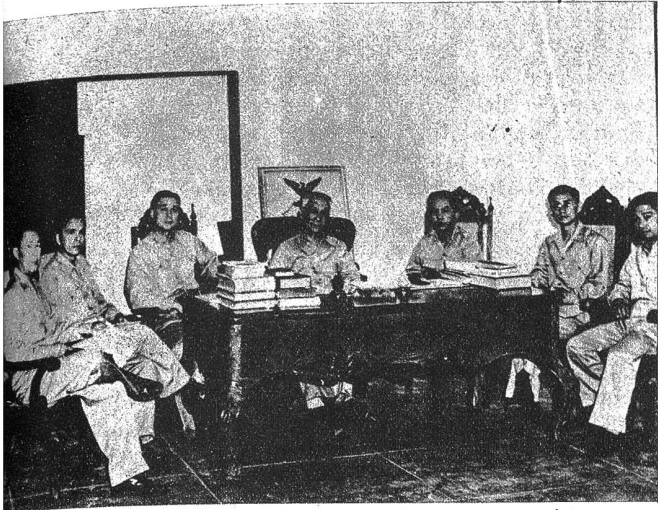
Das philippinische Kriegskabinett hat unter der Leitung von Staatspräsident Sergio Osmena (Mitte) seine Tätigkeit in Tacloban, der provisorisch zur Hauptstadt der Philippinen erklärten grössten Stadt auf der Insel Leyte, aufgenommen. Es bleibt bis zur Durchführung von Neuwahlen der gesamten philippinischen Bevölkerung im Amte

lichen Zweig der schwarzen Rasse. Diese Ureinwohner sind heute aber bedenklich zurückgedrängt. Es leben etwa noch ihrer 30 000 in den unwegsamen Gebirgen und Wäldern, wo sie sich von Wurzeln und Früchten oder mit Hilfe der Jagd ernähren. Im Laufe der Zeit erfolgte ein Einwanderungsstrom von Malaien. Ihre Nachkommen sind zum Teil noch heute Heiden und einige ihrer Stämme sind berüchtigt wegen ihrer Kopffägerei. Später erfolgte ein zweiter Einwanderungsschub der Malaien. Diese stehen kulturell höher; es sind dies die Filipinos, die die Hauptbevölkerung der Philippinen ausmachen. Sie sind meistens römisch-katholisch; 4 Mill. unter ihnen bezeichnen sich zur modernistischen, unabhängigen philippinischen Kirche. Dieser zweite Schub von Malaien erfolgte noch vor der Entdeckung durch die Europäer. Nach der Entdeckung erfolgte ein dritter Schub; die Moros drangen ein, malaisische Mohammedaner, die sich im Süden auf Palawan und Mindanao niederliessen. Ausserdem gibt es noch etwa 200 000 Protestanten.