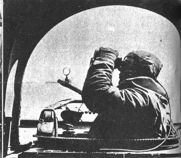
Konzentrierteste Aufmerksamkeit wird vom Heckschützen erwarbt. Die Aufgabe besteht darin, feindliche Flugzeuge unter Beschuss zu halten