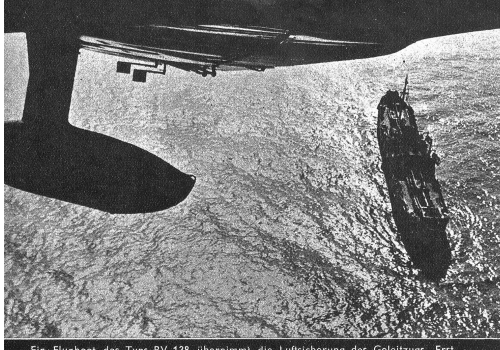
Ein Flugboot des Typs BV 138 übernimmt die Luftsicherung des Geleitzuges. Erst nach acht Stunden wird es abgelöst. Unablässig kreist es über den Schiffen und hält Ausschau nach dem Feind