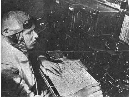
Der Funker des Flugbootes orientiert den Flugstützpunkt und die Schiffe über die Luftlage