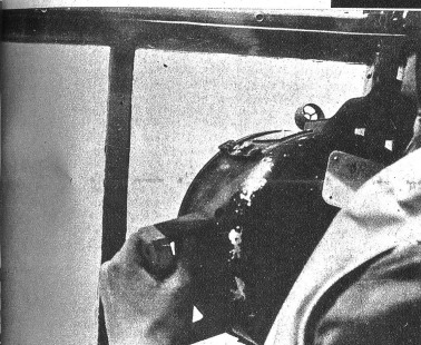
Die Verbindung zwischen Flugboot und Schiffen wird gewöhnlich durch ein Blinkgerät gesichert. Soeben gibt der Beobachter dem Führungsschiff des Geleitzuges mit der Morsellampe eine Meldung durch