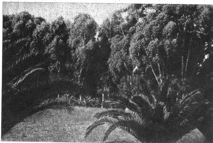
Aus dem Nationalpark von Uruguay

Schon im letzten Weltkrieg brach Uruguay im Oktober 1917 die diplomatischen Beziehungen zu Deutschland ab, ohne allerdings den Krieg zu erklären. Heute jedoch befindet sich Uruguay im Krieg gegen die Achsenländer. Die Wehrmacht, wenn man überhaupt von einer solchen sprechen kann, besteht nur im Kriege, und erst seit kurzer Zeit ist sie in der Ausbildung nach neuen militärischen Prinzipien begriffen, denn im Frieden ergänzte sich das Heer aus Freiwilligen. Das Land unterscheidet das stehende Heer und die Nationalgarde. In der Nationalgarde werden die Bürger vom 17. bis 30. Lebensjahr zu gelegentlichen Übungen herangezogen. Wenn Uruguay heute auch nicht mit Hilfe einer schlagkräftigen Armee irgendwo an einer Front sich beteiligen kann, so sind es um so mehr wirtschaftliche und strategische Vorteile, die die Alliierten durch die Unterstützung Uruguays begrüssen und auszunützen verstehen werden. Tic.