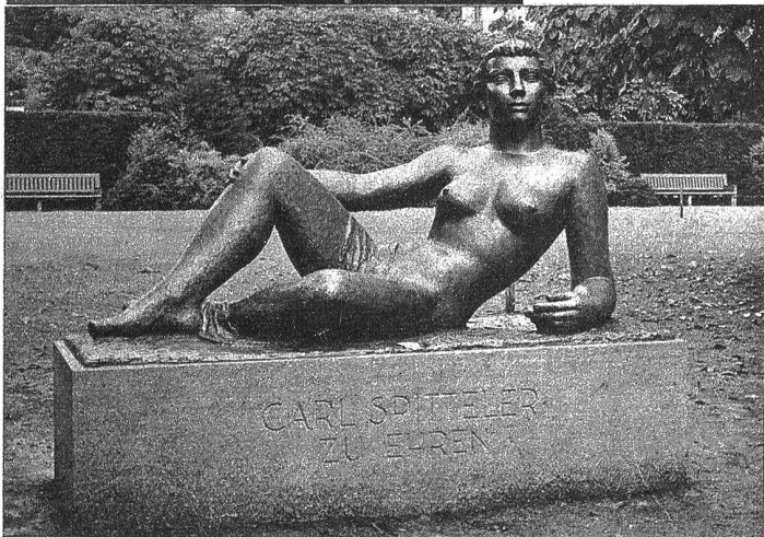
„Carl Spitteler zu Ehren“ ist auf dem Denkmal eingehauen, das die Luzerner dem berühmten Dichter gesetzt haben

mern sollte — dann bitte, kommen Sie sofort und verständigen mich, ja?“