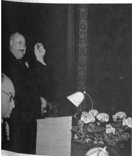
Der Präsident des Schweiz. Gewerbeverbandes, Dr. P. Gysler, spricht über die Nachkriegsprobleme

Seine Ausführungen wurden lebhaft begrüsst, und Präsident Hans Müller sprach im Namen des kantonalbernischen Gewerbeverbandes Dank und die Zusage aus, dass der bernische Gewerbeverband einig und geschlossen für die gefassten Postulate einstehen werde. Sein Schlusswort galt den Nachkriegsproblemen und dem Wunsch, das Vaterland geschützt und gesichert zu wissen. Nach dem Absingen der Nationalhymne marschierte der Kantonalbernische Gewerbeverband geschlossen mit Musikbegleitung zum Mittagsbankett. dok.