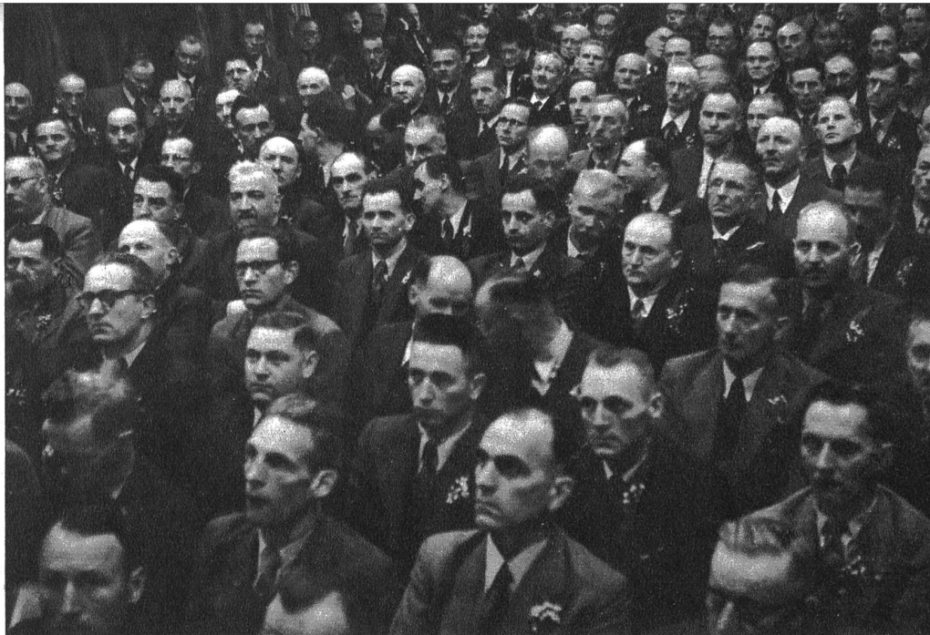
Die bernischen Gewerbler folgen aufmerksam den Ausführungen über das Jahresergebnis