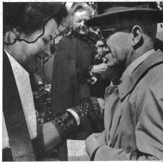
„Das Empfangskomitee an der Arbeit“