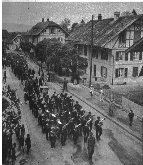
Unter den Klängen der Musik marschiert der kant.-bernische Gewerbeverband durch Lyss.

Ratifikation des Kaufvertrages und über die Kreditverteilung wurde Einstimmigkeit erzielt.