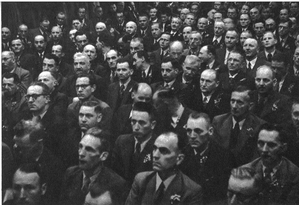
Die bernischen Gewerbler folgen aufmerksam den Ausführungen über das Jahresergebnis