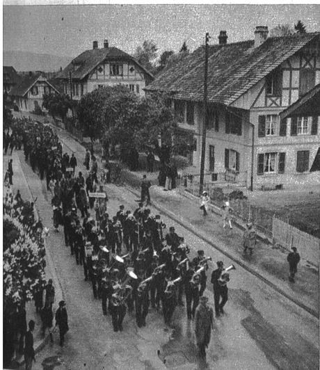
Unter den Klängen der Musik marschiert der kant.-bernische Gewerbeverband durch Lyss.

Ratifikation des Kaufvertrages und über die Kreditverteilung wurde Einstimmigkeit erzielt.