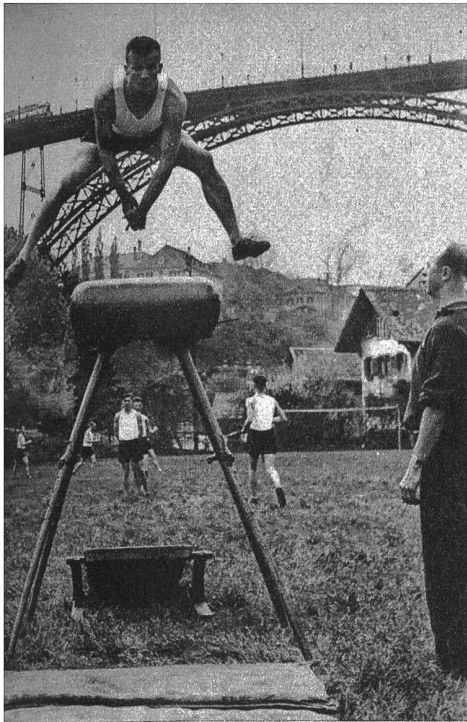
Während der ganzen Schule wurde im Turnen der Schulung des Mutes besondere Bedeutung beigemessen. Unser Bild zeigt einen der Rekruten in einem kühnen Grätschprung über das hochgestellte Pferd. Sämtliche Rekruten meisterten diese Mutübung mit einer Selbstverständlichkeit ohnegleichen