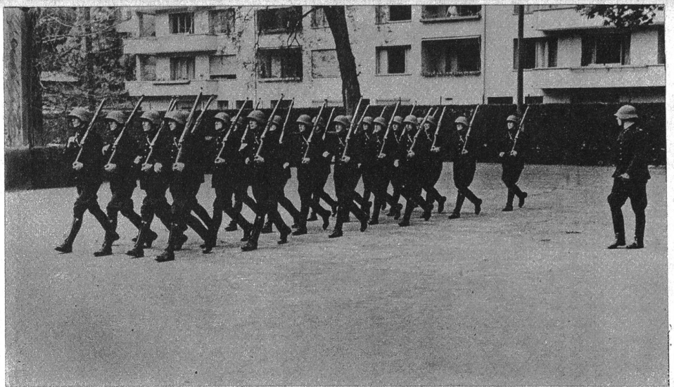
Die physische Abschlussprüfung wurde im Altenberg durch ein strammes Karabinerexerzieren der Polizeirekruten eingeleitet. Im Vordergrund standen dabei Appell- und Drillübungen. Schliesslich „schmetterten“ die Polizisten auch noch einen rassigen Gewehrgriff, der jedem guten Infanteriezug Ehre erwiesen hätte

körperliche Kraft und Geschicklichkeit verfügen können, wie sich der Chef des Eid. Justiz- und Polizeidepartementes, Bundesrat von Steiger, einmal ausdrückte. Aus diesem Grunde geht die Auslese und Ausbildung des Polizeinachwuchses sehr gründlich und sorgfältig vonstatten. Abgeschlossene Berufslehre, körperliche und moralische Tauglichkeit, Kenntnis einer zweiten Landessprache, wenn möglich Unteroffizier in der Armee, zählen heute für alle mit zu den minimalen Erfordernissen, die die Absicht hegen, in die harte, aber sehr vielseitige und überaus lehrreiche Polizeirekrutenschule einzutreten.