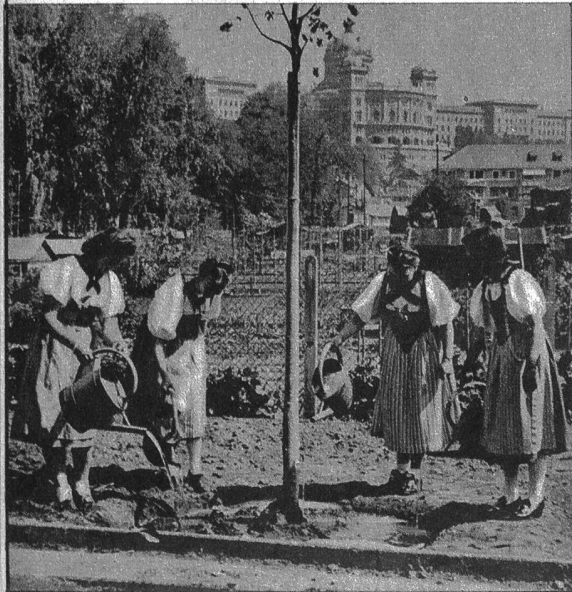
Links: Vier Schülerinnen der obersten Seminarklasse durften die Friedenslinde pflanzen

len. Im Einvernehmen mit der städtischen Schuldirektion, der städtischen Baudirektion und der Stadtgärtnerei hatten Stadtbaumeister Hiller und Architekt Schwaar schon am frühen Morgen den Platz bezeichnet, wo eine junge Linde als Andenken an den Tag der Waffenruhe gepflanzt werden sollte. Einige Schülerinnen der obersten Seminarklasse widmeten sich alsdann mit Feuereifer dieser Aufgabe, so dass um 10 Uhr, als die rund 160 Mädchen sich besammelten, der junge Baum in der Frühlingssonne auf seinem ihm zugewiesenen Platze stand.