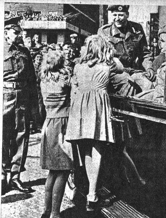
Rechts: Der norwegische Kronprinz Olaf ist nach langer Emigration nach Norwegen zurückgekehrt, wo er von der Bevölkerung stürmisch begrüßt und gefeiert wurde