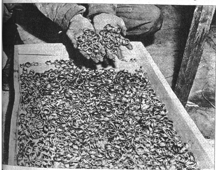
Dass in den Konzentrationslagern, in welchen die Gefangenen systematisch zu Tode gequält wurden, auch die Leichen beraubt wurden, ist selbstverständlich. Aber man bekommt doch einen Schreck, wenn man diese Berge von Ehingen betrachtet, welche jetzt die Alliierten aufgefunden haben, denn jeder Ring erzählt von einer grausamen Tragödie