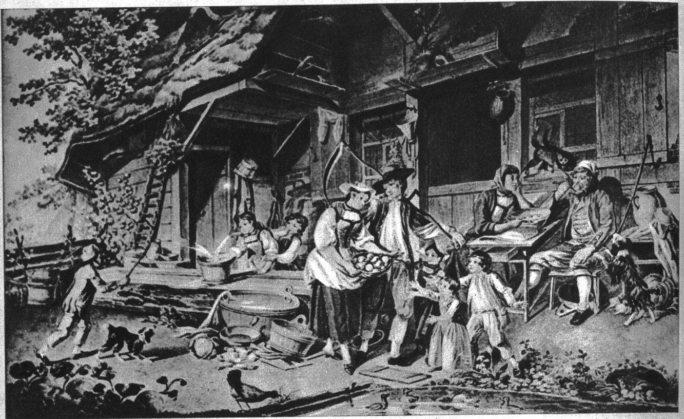
Heimkehr von der Ernte