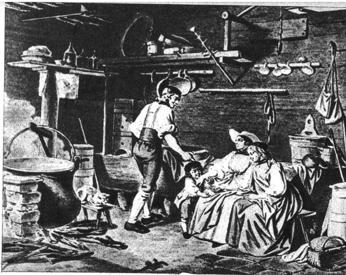
In der Sennhütte

Im Jahre 1773 reiste er in die Schweiz und fand in Bern, seinem Heimatort, so liebevolle Aufnahme, dass die Menge von bestellten Arbeiten ihn an keine Rückkehr nach Paris mehr denken liess. Schilderungen vaterländischer Sitten und Bräuche zeigten die Schweiz von einer neuen, interessanten Seite. Alle ländlichen Darstellungen von Freudenberger tragen das Gepräge entzückender Naivität und zeigen, wie die Kunst verschönert, ohne von der Wahrheit und Natur abzuweichen. Er übertrug den galanten Zeichnungsstil Bouchers und die Sentimentalität von Greuzes auf Szenen des Berner Bauernlebens. Eine Eleganz der Zeichnung, schöne Gruppierung der Figuren sind neben dem idyllischen Charakter der Bilder die Verdienste all dieser beliebten Blätter. Das Liebenswürdige und Gefällige hat hier im Kleinbild Eingang gefunden. In seinem Atelier befanden sich zahlreiche Schüler, u. a. Niklaus König, der ebenfalls Motive aus dem Bauernleben bezog, und Daniel Lafond, der Freudenbergers Geschäftsnachfolger wurde und in dessen Stil Stiche herausgab.