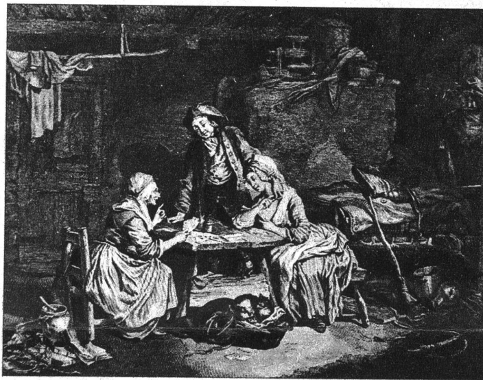
Das neugierige Ehepaar