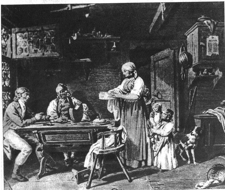
Links: Besuch im Bauernhaus