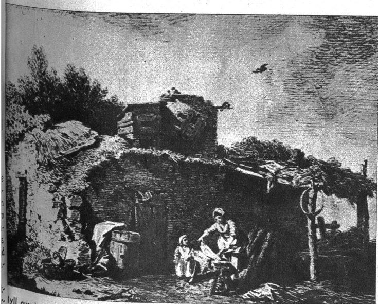
lyll aus der Pariserzeit, das sehr gut den Einfluss der holländischen Kleinmeister dokumentiert