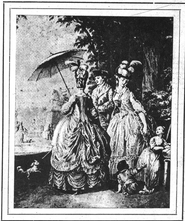
«La Promenade» («Der Spaziergang») entstand während Freudenbergers Aufenthalt in Paris