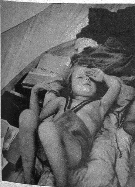
Ein Schläfchen im Zelt

Unten: Das Mittagessen in der freien Luft dürfte alt und jung besonders gut munden