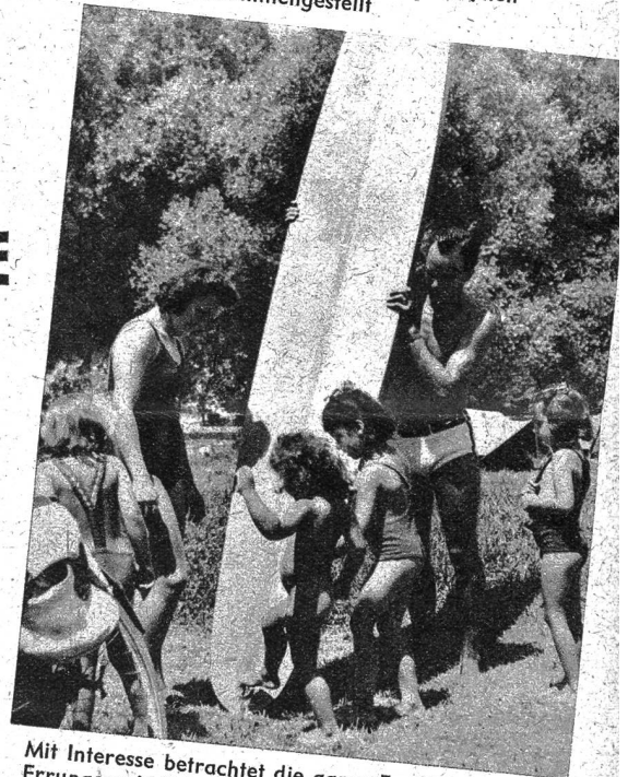
Mit Interesse betrachtet die ganze Familie die neue Errungenschaft, das Hawaiboot, mit dem man auf den Wellen der Aare reiten kann

Unten: Das Mittagessen in der freien Luft dürfte alt und jung besonders gut munden