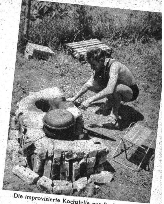
Die improvisierte Kochstelle aus Backsteinen zusammengestellt