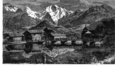
So sah Interlaken Ende des 18. Jahrhunderts aus (Nach einem Bilde von C. Rheiner)