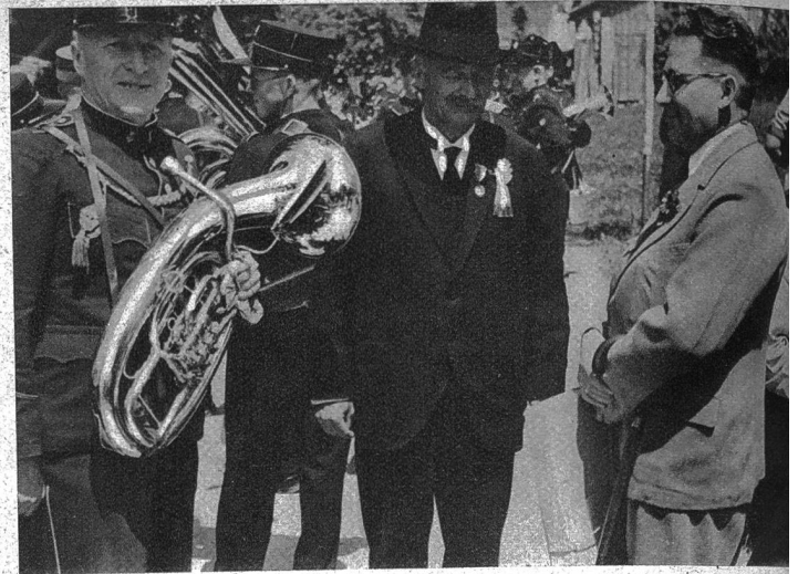
Oben: Nettes Bildchen aus dem Umzug. In der Mitte der Trompeter vom Grauholz, der erste Vorläufer der Musikgesellschaft