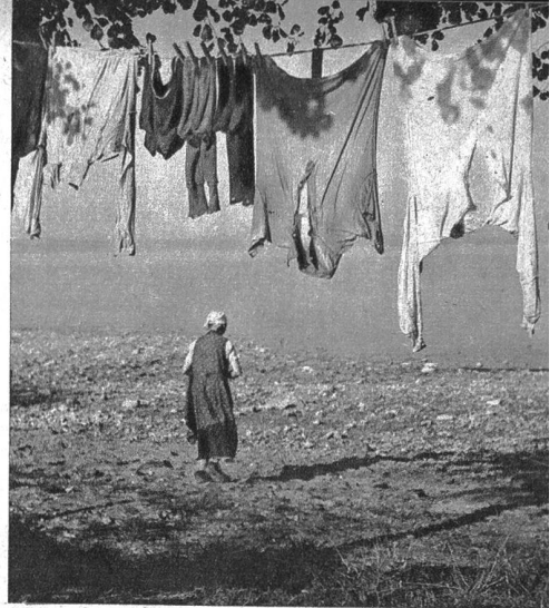
Auf dem Weg zum grossen Spülbecken