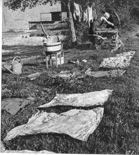
Im Gras und an der Sonne kann die Wäsche gut trocknen und wird schneeweiss