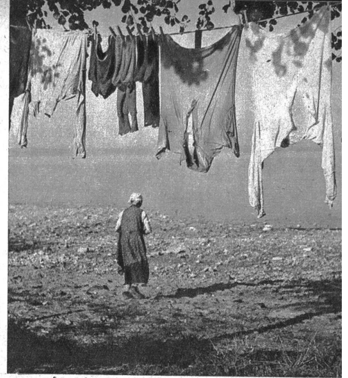
Auf dem Weg zum grossen Spülbecken