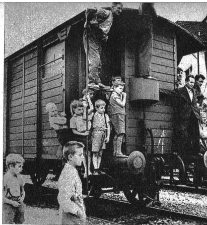
Zaungäste bewundern den Festzug