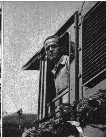
Der Lokomotivführer, der den ersten elektrisch betriebenen Zug führte