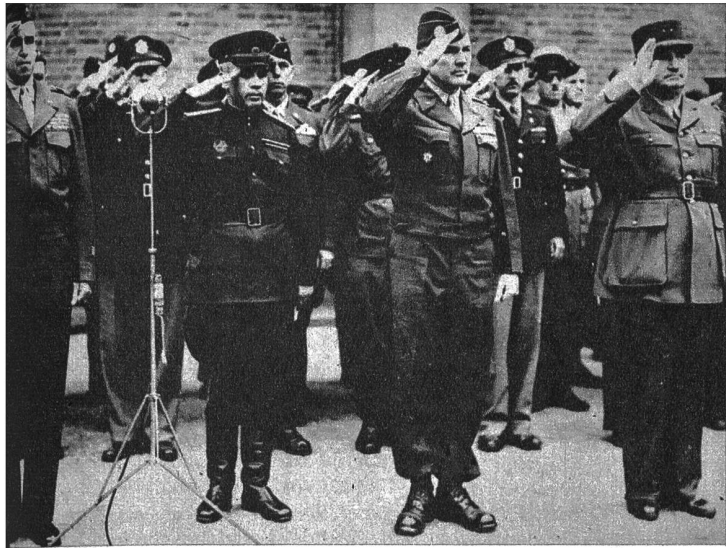
Durch den Einmarsch der Amerikaner, Engländer und Franzosen ist die Besetzung der Reichshauptstadt durch die vier grossen alliierten Nationen praktisch vollzogen. Wir zeigen vier alliierte Truppenchefs anlässlich des Einzuges der Engländer, Amerikaner und Franzosen in Berlin. Von links nach rechts: General Bradley (USA), General Barinow (Russland), Generalmajor Parks (England) und General Duchane (Frankreich (Ph. P.)

Oben rechts: Die Nachkriegspläne der amerikanischen Automobilindustrie liegen bereits vor. Es sollen in den ersten Jahren je 6 000 000 Wagen gebaut werden, bis der erste „Automobillunger“ befriedigt ist, denn in den USA ist seit dreieinhalb Jahren kein Personen-Automobil hergestellt worden. Die Ford-Motor-Co. hat bereits ihr neues Modell 1946 herausgebracht. Es ist der „Mercury“, der eine neue, windschnittige und breit wirkende Form erhalten hat (ATP)