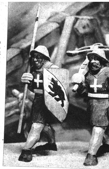
Zwei wackere Kriegerknechte der bernischen Streitmacht

Reportage: ILLUSTRATION