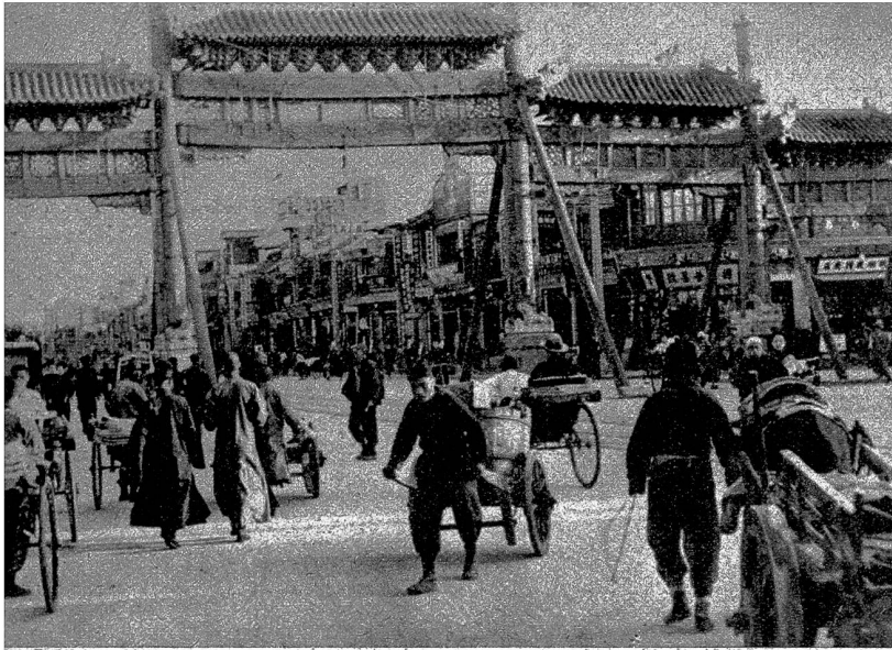
Peking ist am 25. Juli 1937 von den Japanern überfallen und von den Chinesen sofort geräumt worden. Die erste von Japan eroberte Grossstadt wird jetzt von den Japanern geräumt