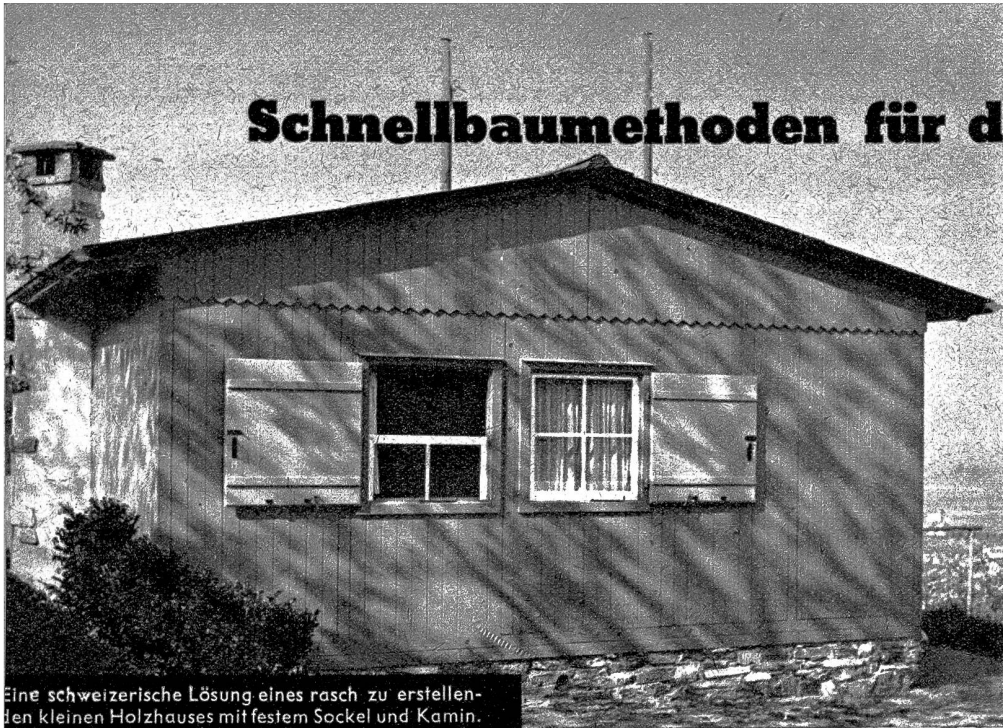
Eine schweizerische Lösung eines rasch zu erstellen- den kleinen Holzhauses mit festem Sockel und Kamin. Da wesentliche Teile fabrikmässig hergestellt werden können, dürfte diese Ausführung als Export- haus wohl in Frage kommen