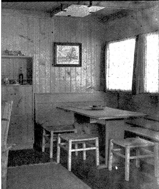
Innenansicht aus dem kleinen Schweizer Holz- haus. Wenn auch einfach, so ist die Ausstattung doch sehr wohnlich

D ie Zerstörungen dieses Krieges haben solche Ausmasse angenommen, dass schon heute von der raschen Entwicklung geeigneter Schnellbaumethoden Sein oder Nichtsein von weit mehr als 10 Millionen Menschen in Europa abhängt.