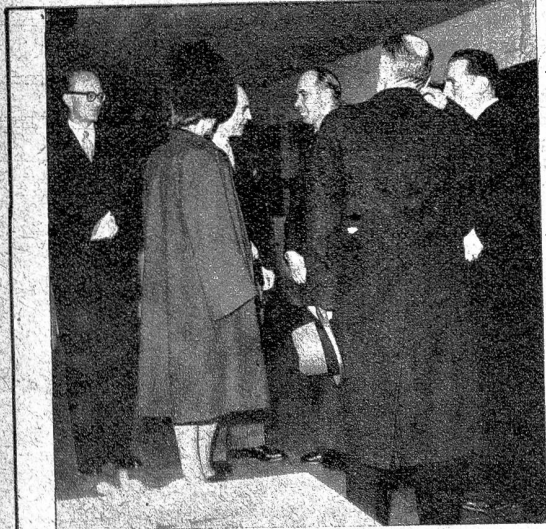
Unser Bild zeigt (von links nach rechts): Legationsrat Dr. Zuber, Herr und Frau Minister Skylstad, der norwegische Gesandte in Bern, Minister Tapio Voionmaa, der finnische Gesandte, Minister Constantin Psaroudas, der griechische Gesandte und Paul Richème, der Sekretär der Schweizer.-Norweg. Gesellschaft