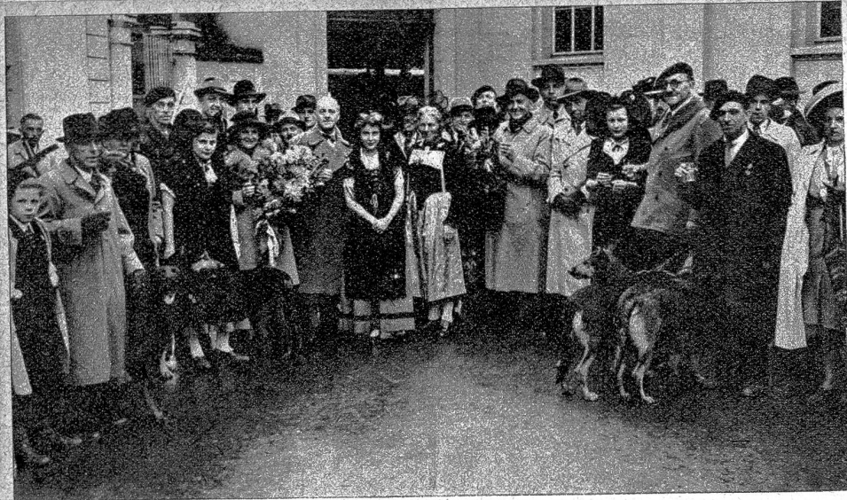
Ankunft der Gäste aus dem Elsass anlässlich der 1. Schweiz. Diensthunde-Ausstellung in Bern