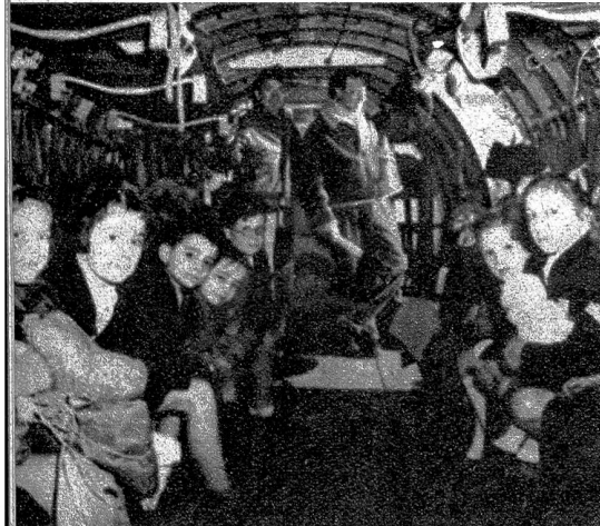
Links: Auf Einladung der schwedischen Regierung kommen in allernächster Zeit 1000 Franzosenkinder zu einem halbjährigen Erholungsaufenthalt nach Schweden, wo sie, genau wie dies in der Schweiz geschieht, bei Familien untergebracht werden. Um den Kindern die Reise Strapazen zu erleichtern, legen sie die weite Reise von Paris nach Stockholm im Flugzeug zurück