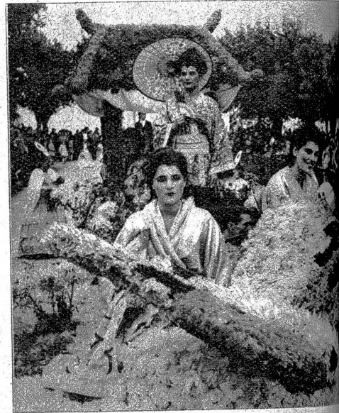
Rechts: Erstmals nach sechs langen Kriegsjahren ist in Neuenburg wieder das Fest der Weinlese durchgeführt worden, das denn auch ganz im Zeichen des Friedensstandes. Aus dem grossen Winzerzug haben wir den eindrucksvollen Blumenwagen „Madame Butterfly“ festgehalten