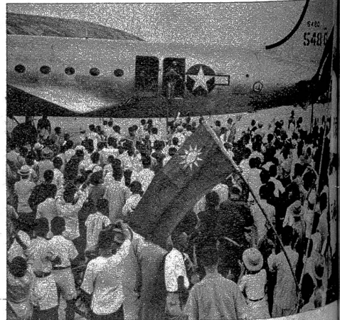
Rechts: Die Besetzung der wichtigen chinesischen Hafenstadt Schanghai wickelte sich recht unkriegerisch ab. Pünktlich zur festgesetzten Stunde erschienen über der Stadt amerikanische Transportflugzeuge, welche auf dem Flugplatz niedergingen. Den Apparaten entstieg chinesische Truppen der Zentralregierung, welche von der wartenden Bevölkerung mit Fahnen und Spruchbändern herzlich empfangen wurden