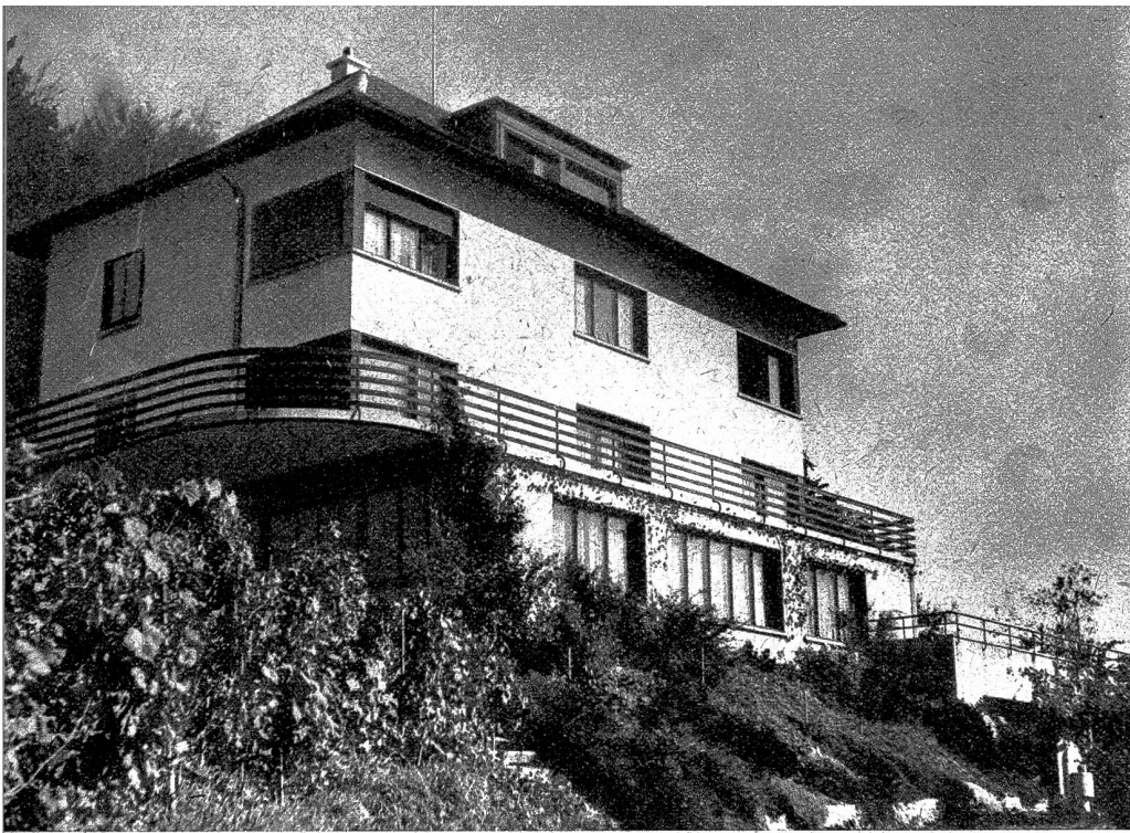
Ansicht des Bürogebäudes der Firma A. Gerber & Cie. AG. in Lyss

D ieser Ausspruch aus dem 17. Jahrhundert hat heute die gleiche Geltung wie anno dazumal. In jedem Gewerbe oder Handelsunternehmen ist die Zeit massgebend, und bei Unternehmungen, welche noch dazu mit rasch verderblicher Ware in nützlicher Zeit die Verteilung vornehmen müssen, gilt das Gebot der Zeit doppelt. Früh beginnen, rasch handeln und gewissenhaft arbeiten ist noch heute der Grundsatz der Firma Gerber, die in relativ kurzer Zeitspanne ihre Bewährung unter Beweis stellen konnte.