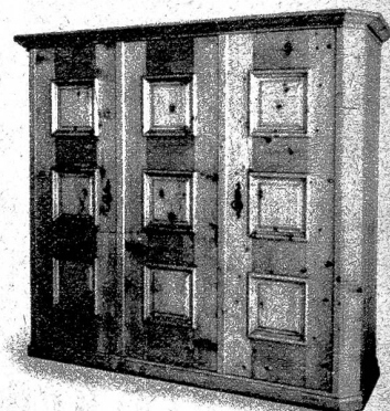
Schrank aus einem Schlafzimmer in Arvenholz. Entwurf: Rud. Fahrler, Möbelzeichner