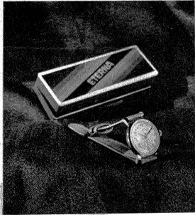
Die gute, zuverlässige Arm- banduhr ist wertvoll und geschätzt