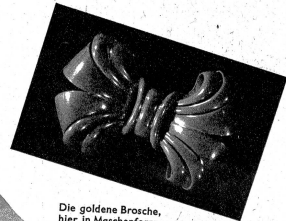
Die goldene Brosche, hier in Maschenform, ist ein schönes bleibendes Geschenk