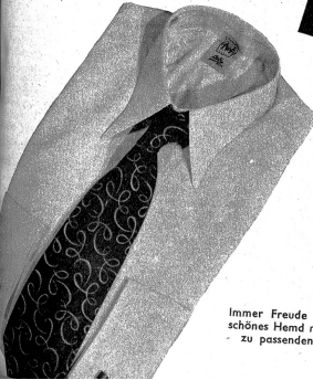
Immer Freude bereitet ein schönes Hemd mit einer dazu passenden Krawatte