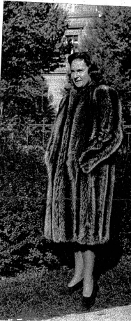
Dieser langhaarige Pelzmantel aus solidem Waschbär in schönen Streifen verarbeitet dürfte immer willkommen sein