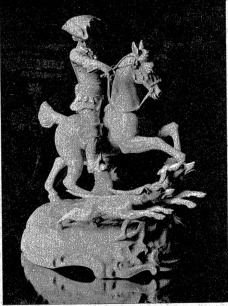
Ist sie nicht schön, diese Porzellanfigur. Ein solches Geschenk wird sicher immer erfreuen