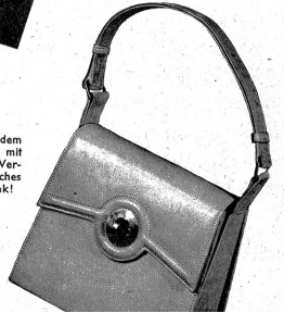
Eine schöne Tasche in dem modernen hellen Ton, mit einem interessanten Verschluss. Welch praktisches und beliebtes Geschenk!