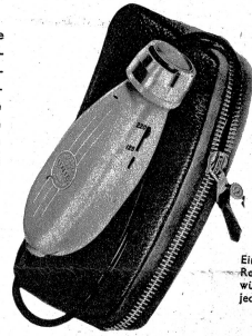
Ein elektrischer Rasierapparat wünscht sich bestimmt jeder Herr