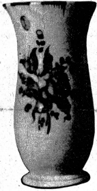
Die handgemalte Vase aus Porzellan oder Keramik dürfte an manchem Ort willkommen sein