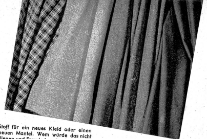
Stoff für ein neues Kleid oder einen neuen Mantel. Wem würde das nicht dienen und Freude bereiten? Was mag wohl 1 m kosten?