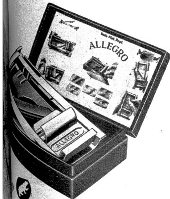
...stern ist der Herren Plage. Mit Klingenschleif- und Abziehapparat aber wird es zur Freude