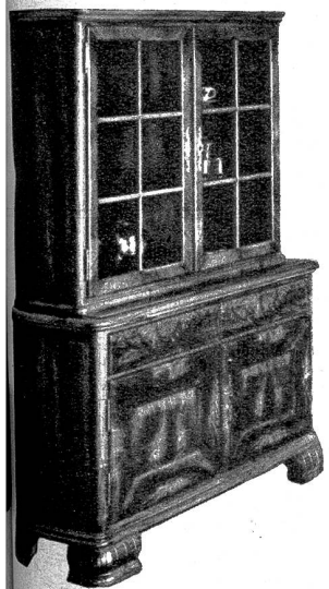
Eine schöne und praktische Vitrine dürfte jeder Hausfrau willkommen sein