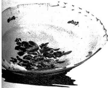
Die schöne Keramikplatte findet vielfache Verwendung und dürfte mancherorts Freude bereiten