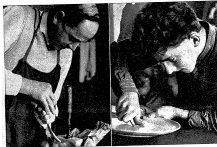
Links: Dieser Arvenstock erhält langsam die Form der gewünschten Schale. Auch hier ist ein Sekundarlehrer an der Arbeit. Rechts: Verlieft in sein schöpferisches Werk. Dieser junge Kunstgewerbler aus dem Habkernal, der eine Werkschleife für Bauernkunst begründen will, ist mit voller Hingabe und Konzentration an seiner Arbeit