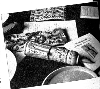
Die Schulschachtel wird mit einem alten stillenmotive beschnitzt. Links: Student fertige Werke der Kursteilnehmer. Ein kunstvoll eingeschnitztes Alpofuz, ein altes Rasgeschirr aus dem Jahre 1736, rechts: Kertschnitt ganz links eine über Schiebenschachtel und im Vordergrund Literatur über Volkskunst im Berner Land