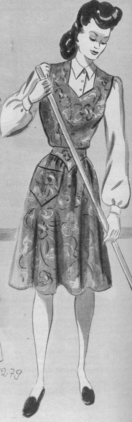
1279. Die praktische Hausschürze in gut sitzender Form