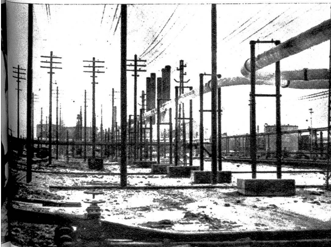
Die grosse Oelraffinerieanlage der Anglo-Iranian-Oil Company am Schatt el Arab mit einer Belegschaft von 20 000 Arbeitern. Täglich verlassen hier drei Tankdampfer mit 9 000 Tonnen den Hafen