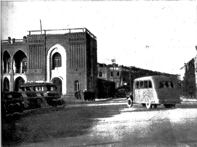
Teheran, Hauptstadt und geistiger Mittelpunkt Irans. Das Bild zeigt den Meidan Sepah (Platz der Armee) und Rathaus

Ten Leert ist ruhig sitzen geblieben und hat dem Auftritt halb erstaunt, halb missbilligend zugesehen, als ginge ihm das alles gar nicht unmittelbar an. Schliesslich schüttelt er beinah bedauernd den Kopf. Verrückt — total verrückt, denkt er bei sich. Fünfhunderttausend Francs verpulvern und dann noch den wilden Mann spielen!... Und diese Geschichte mit der vertauschten Mappe und mit dem Buchhalter, den er natürlich hat verduften lassen. Was für plumpe Tricks! Ein ganz dilettantischer Gauner. Von den letzten 24 000 Francs ist natürlich der Goldbarren gekauft worden, den er dem Bogadyn präsentiert hat. Ein grober Schwindel, das Ganze. Mein guter Bonster muss ihm damals aufgefressen